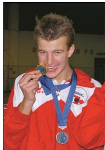
Giuliano Cairoli campione Europeo 2010